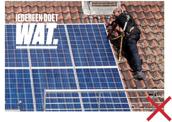
NIET ZONDER KADER IN WIT