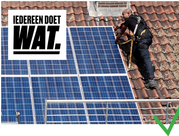
GEBRUIK HET LOGO IN HET WITTE KADER

Bij gebruik van het logo op fotografie, zet het dan altijd in het kader, nooit losstaand.