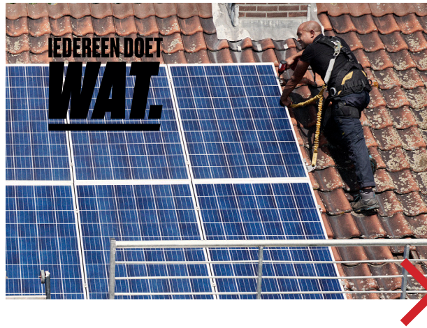
NIET ZONDER KADER IN ZWART